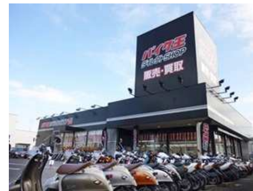
【バイク王ダイレクトSHOP16号相模大野店】

※2011年10月末に「バイク王ダイレクトSHOP大阪171号店」を移転し、同年11月に「バイク王ダイレクトSHOP171号伊丹店」をオープン予定。