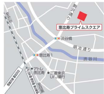
各線「恵比寿」駅より、徒歩8分