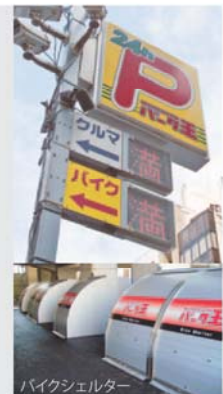
バイクシェルター