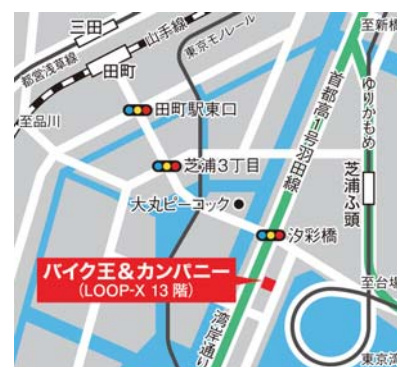
JR線「田町」駅シャトルバス5分/徒歩12分 ゆりかもめ「芝浦ふ頭」駅 徒歩5分