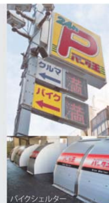
バイクシェルター