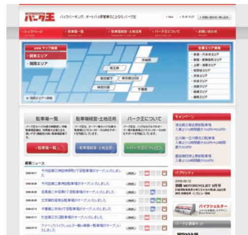
■パーク王コーポレートウェブサイト

この背景には、パーク王の事業地数・車室数の増加、ユーザーニーズの多様化が挙げられます。この機会にパーク王として初となる携帯電話向けサイトをオープンすることで、パーク王の全事業地を、いつでも・どこでも・手軽に検索することができます。そして、機能性の補完を目的に、PC向けサイトに二次元バーコードを配し、携帯電話向けサイトに誘導することで、ユーザーに対するさらなる利便性向上を図っております。